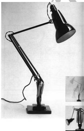
شکل ۲. چراغ مطالعه به رنگ سیاه، طراح George Carwardine، ۱۹۳۲. [Ibid. p. 52]