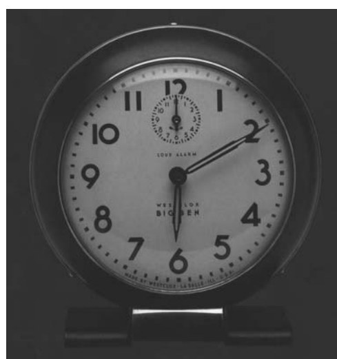
شکل ۵. ساعت زنگدار رومیزی "بیگ بن" به رنگ سیاه، طراح Henry Dreyfuss، ۱۹۳۹. [Ibid.]