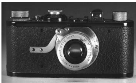
شکل ۱. دوربین Leica به رنگ قهوه‌ای، طراح Oskar Barnack، ۱۹۱۳. [Ibid. p. 27]

از لحاظ تاریخی نمی‌توان به رابطه مهم و اساسی بین رنگ و طراحی صنعتی، مگر در چند دهه اخیر، دست پیدا نمود. با رجوع به وضعیت صنایع در اوایل قرن بیستم میلادی و مطالعه تاریخی این دوره، در می‌یابیم تا چه حد طراحی صنعتی در تعیین رنگ محصولات ناتوان بوده است (اشکال ۱ تا ۵). دلایل مختلفی بر این امر دلالت دارند: