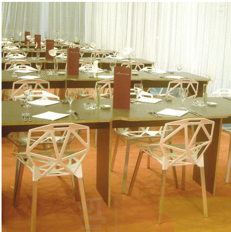
تصویر ۱۹: طراحی داخلی یک رستوران با بهره‌گیری از صندلی‌های مشهور گرسیک

سوی انجمن سلطنتی هنر، صنعت و تجارت انگلستان، «سلطان طراحی برای صنعت» لقب گرفت. در همان سال، نمایشگاه معتبر طراحی میامی ۱ آمریکا، جایزه‌ی «طراح سال ۲۰۱۰» را به گرسیک اختصاص داد ۲ . جایزه‌ای که پیش‌تر به معمار مشهور، زها حدید ۳ اهدا شده بود.