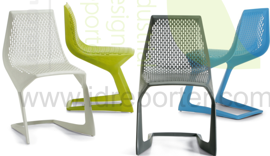
تصویر ۹: صندلی میتو (Myto)، طراحی برای Plank، با همکاری شرکت BASF، ۲۰۰۸

دیگر شاهکار گرسیک در گستره‌ی طراحی مبلمان، که به راستی انقلابی فناورانه به شمار می‌رفت، طراحی صندلی موسوم به میتو ۲ بود که به سال ۲۰۰۸ برای شرکت ایتالیایی پلانک ۳ انجام گرفت. طراحی این صندلی معلق ۴ ، به یمن بهره‌گیری از ویژگی‌های بی‌مانند ماده‌ی جدیدی در صنعت پلاستیک امکان‌پذیر شد. این پلاستیک جدید که توسط یک شرکت شیمیایی