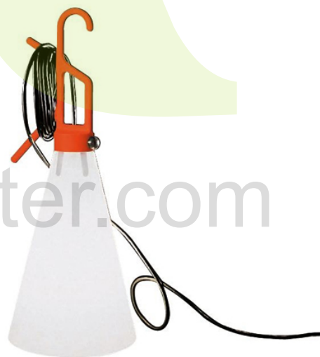
تصاویر ۱ و ۲: نورافکن قابل حمل Mayday. طراحی برای شرکت تجهیزات روشنایی Flos. ۱۹۹۸