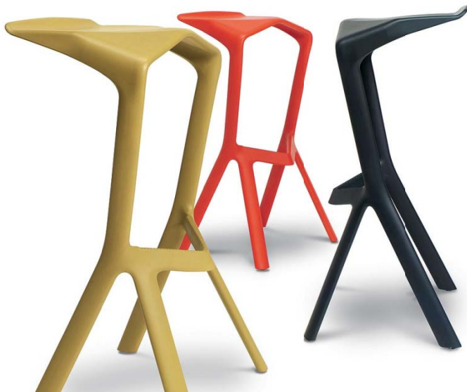
تصویر ۱۰: صندلی پیشخوان Miura در رنگ‌های گوناگون، طراحی برای Plank، ۲۰۰۵

آلمانی ۱ ابداع شده بود، قابلیت شکل‌پذیری و در عین حال استحکام بسیار بالایی داشت و از این رو، آرمان گرسیک را برای طراحی یک صندلی معلق محقق ساخت. این پروژه‌ی جاه‌طلبانه در قالب یک فعالیت گروهی با همکاری دو شرکت پیش‌گفته در کمتر از یک سال به نتیجه رسید و اثری ظریف و ماندگار آفرید. اثری که با نمونه‌های مشابه پیشین - همچون صندلی معلق مارسل بروئر ۲ ، میس وان د روهه ۳ ، ورنر پانتون ۴ و ... - کاملاً متفاوت بود و به نوعی محصول عصر خویش به شمار می‌رفت. این اثر به سرعت، به مجموعه‌ی گنجینه‌ی دائمی نمادهای طراحی معاصر در موزه‌ی هنر مدرن نیویورک پیوست. گرسیک خود در این باره می‌گوید: «انعطاف‌پذیری این صندلی، همراه با استحکام خارق‌العاده‌ی آن، تنها با این نوع پلاستیک میسر بود. این ماده در حالت مذاب، دو برابر پلاستیک معمول، قابلیت تحرک دارد و این به تولیدی ارزان‌تر و صرفه‌جویانه‌تر می‌انجامد و از همه مهم‌تر، محصولی دوستدار محیط‌زیست می‌آفریند».