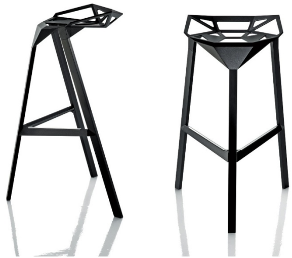
تصویر ۷: صندلی پیشخوان یک Stool ONE، طراحی برای Magis، ۲۰۰۴

از حرفه‌های مثلثی شکل آلومینیومی بود که بنا بر زوایای خاصی نسبت به یکدیگر شکل گرفته بودند. گرسیک، ساخت این صندلی چندوجهی را به ساخت یک توپ فوتبال تشبیه کرد. وی، سپس بر پایه‌ی این طرح فرمی که عمدتاً در دو رنگ قرمز و سیاه ارائه می‌شد، اقدام به طراحی نسخه‌های متفاوتی از آن، با پایه‌های گونه‌گون و از جمله صندلی پیشخوان (صندلی کافه‌ای) کرد. این طرح که بنا بر گفته‌ی گرسیک، از شکل هندسی توپ فوتبال الهام می‌گرفت، شور و اشتیاق وی را برای طراحی لوازم ورزشی نشان می‌داد؛ علاقه و گرایش که بعدها در طراحی محصولات ورزشی و از جمله طراحی کفش برای شرکت آدیداس تداوم یافت.