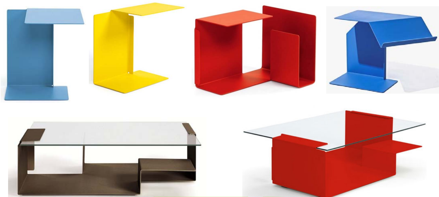
تصاویر ۱۷-۱۲: نمونه‌هایی از مجموعه میزهای دیانا در طرح‌ها و رنگ‌های گوناگون، طراحی برای ClassiCon، ۲۰۰۲

آنچه گرسیک را ممتاز و یگانه می‌سازد، نگاه او به فرایند طراحی است. وی فرایند طراحی را امری بسیار جدی و هوشمندانه برمی‌شمرد و از این رو، به موضوع طراحی چندان توجهی ندارد. شاید از این روست که وی طراحی طیف متنوعی از محصولات ساده را از خودکار و چتر گرفته تا سبد و سطل زباله در کارنامه‌ی خویش جای داده است. از نگاه وی، ایده‌ی مستتر در طرح حایز اهمیت است، نه موضوع آن و اینکه آن ایده، چه ارزش افزوده‌ی نوینی به طرح بارها دیده‌شده، بخشیده است. منتقدان، گرسیک را طراحی کمینه‌گرا (مینیمال) می‌پندارند؛ اما خود او ترجیح می‌دهد که به هیچ سبکی وابسته نباشد و همواره ساده‌گرایی را -که به نوعی شوخ‌طبعی فرم‌گرایانه مزین شده- سرلوحه‌ی کار خویش قرار دهد.