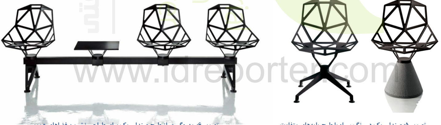
تصویر ۶: بهره‌گیری از طرح صندلی یک برای طراحی نشیمن فضاهای عمومی

بی‌تردید، یکی از شاهکارهای گرسیک که به راستی، یکی از نمادهای برجسته‌ی طراحی معاصر به شمار می‌رود، صندلی موسوم به صندلی یک ۶ بود که برای شرکت معتبر مگیس ۷ در سال ۲۰۰۴ طراحی کرد. این اثر که به واقع اثری موزه‌ای و نمایشی بود، در سال ۲۰۰۷، برای نمایش در نمایشگاه مشهور ۲۵/۲۵ - که به بهانه‌ی بزرگداشت ۲۵ سال طراحی معاصر در موزه‌ی طراحی لندن برگزار شده بود - برگزیده شد و به نوعی اعتبار جهانی یافت. فرم این صندلی، در حقیقت، ترکیبی هندسی