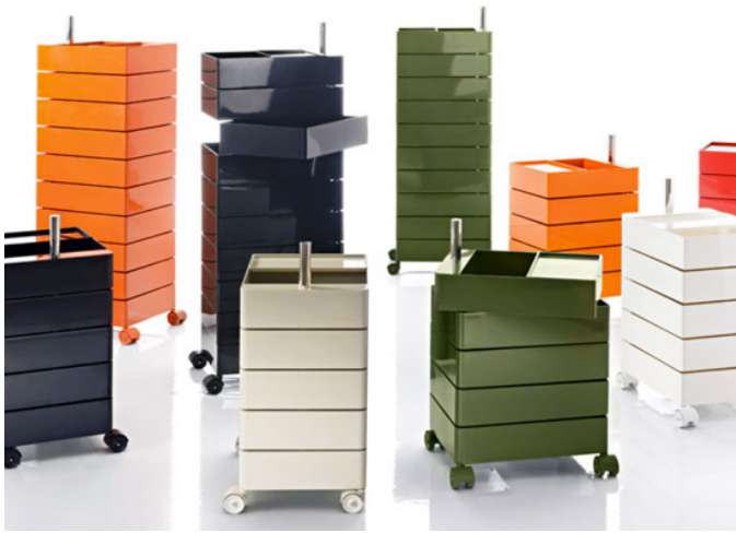
تصویر ۸: محفظه‌های بایگانی ۳۶۰ در رنگ‌های گوناگون، طراحی برای Magis، ۲۰۱۰