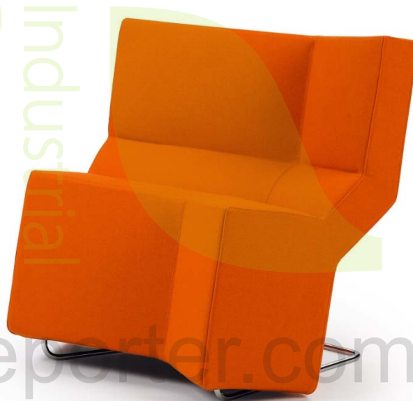
تصویر ۱۱: مبل راحتی Chaos در رنگ نارنجی، طراحی برای ClassiCon، ۲۰۰۱

گفتنی است پروژه‌ی میتو در تداوم همکاری گرسیک با شرکت مبلمان پلانک بود که پیش‌تر به طراحی موفق صندلی پیشخوان میورا ۵ - در سال ۲۰۰۵ - انجامیده بود. میورا در واقع، تداوم زبان زیباشناختی احساس‌گرایی بود که گرسیک با طرح صندلی یک خود در سال پیش معرفی کرده بود. وی ۶ این زبان طراحی را پیش‌تر در محصولات دیگری همچون دیانا ۷ و اسوروم ۸ به کار گرفته بود. دیانا، میزهای عسلی کوچکی بودند که با برش و خم کردن ورق‌های فولادی در اندازه‌ها و زوایای مختلف شکل گرفته و در رنگ‌های گوناگون رنگ‌آمیزی شده بودند. این مجموعه، در سال ۲۰۰۲، برای شرکت کلاسیکون ۹ طراحی شدند. اسوروم، نیز یک میز قهوه‌خوری صابون‌شکل بود که برای شرکت موروسو ۹ در سال ۲۰۰۴ طراحی شد و فناوری نوین را به عنوان ابزاری توانمند در طراحی مبلمان در دستان گرسیک قرار داد. گفتنی است نام این محصول از معکوس خواندن نام شرکت سازنده‌ی آن شکل گرفت.