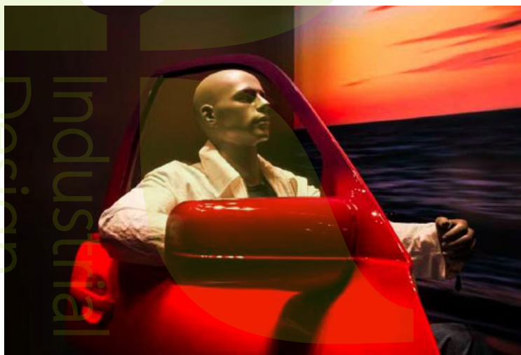
تصاویر ۲۰ و ۲۱: طراحی برای ویتترین فروشگاه‌های Maison Hermes با موضوع و عنوان اتوبان، توکیو، ۲۰۰۹